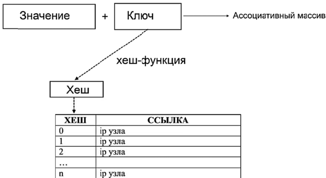
Рис. 1. Хэширование

Хэш – это обычное целое число от 0 до n. Каждый хэш содержит ip узла. В памяти хранятся только основные значения, весь массив данных не хранится [4].